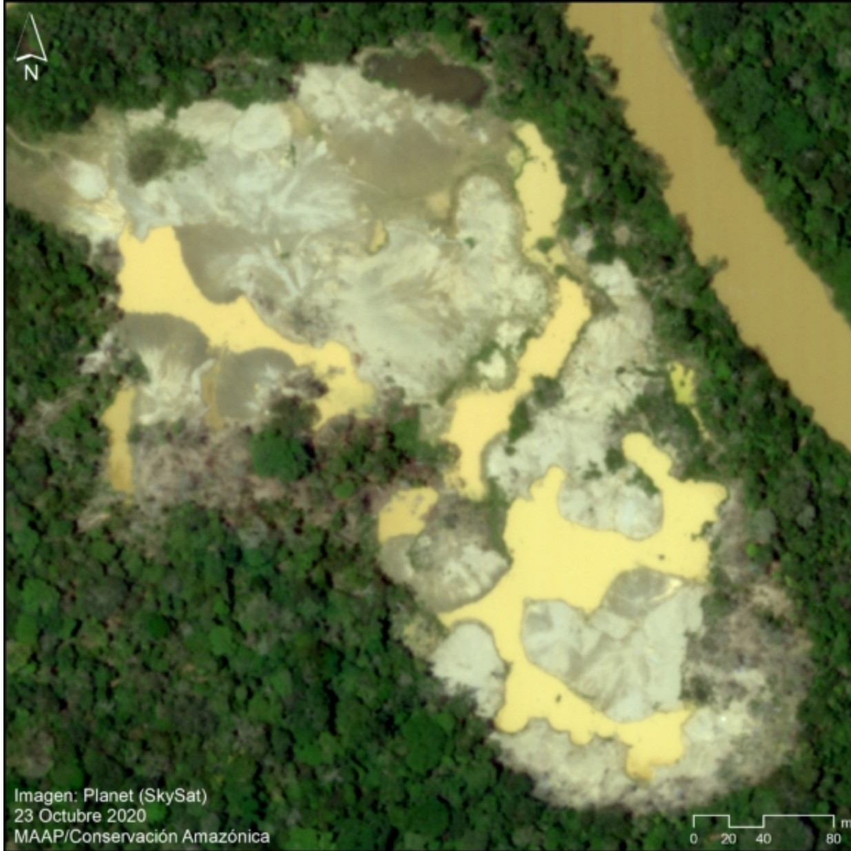
Imagen 1. Imagen de muy alta resolución de la reciente deforestación (10 hectáreas) por minería aurífera en el nuevo foco en torno al río Pariamanu. Datos: Planet (Skysat)