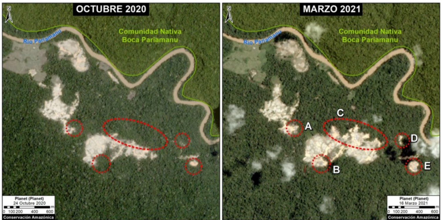
Imagen 2. Datos: Planet, MAAP.

Como se ha mencionado más arriba, Pariamanu representa un caso emblemático que vincula la tecnología con la gestión y acción de las entidades públicas y sociedad civil al abordar la actividad ilegal en la Amazonía, y un caso concreto de una colaboración entre la sociedad civil y el gobierno para lograr cero deforestación (y deforestación evitada).